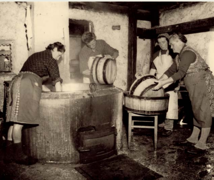
Sirarna na Planini Laz